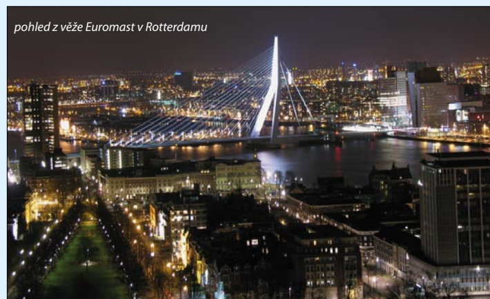
pohled z věže Euromast v Rotterdamu